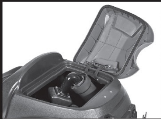
L'ouverture large sur le réservoir de récupération facilite le nettoyage